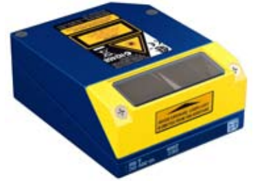
Miroir de renvoi pour les zones restreintes