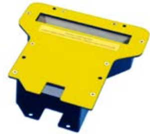
Miroir courte distance de lecture